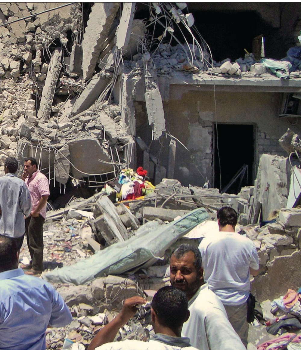
Det er helt nødvendig med en uavhengig gransking av Norges deltakelse i krigen i Libya

seg. Her beskrives Libya som et land hvor lovløsheten råder. Det dokumenteres tusenvis av offentlige likvideringer, drapsforsøk, tortur, voldtekter, trusler, trakassering og vilkårlig fengsling. Mange av forbrytelsene kan utgjøre krigsforbrytelser ifølge FNs menneskerettighetssjef Zeid Ra'ad Al Hussein.