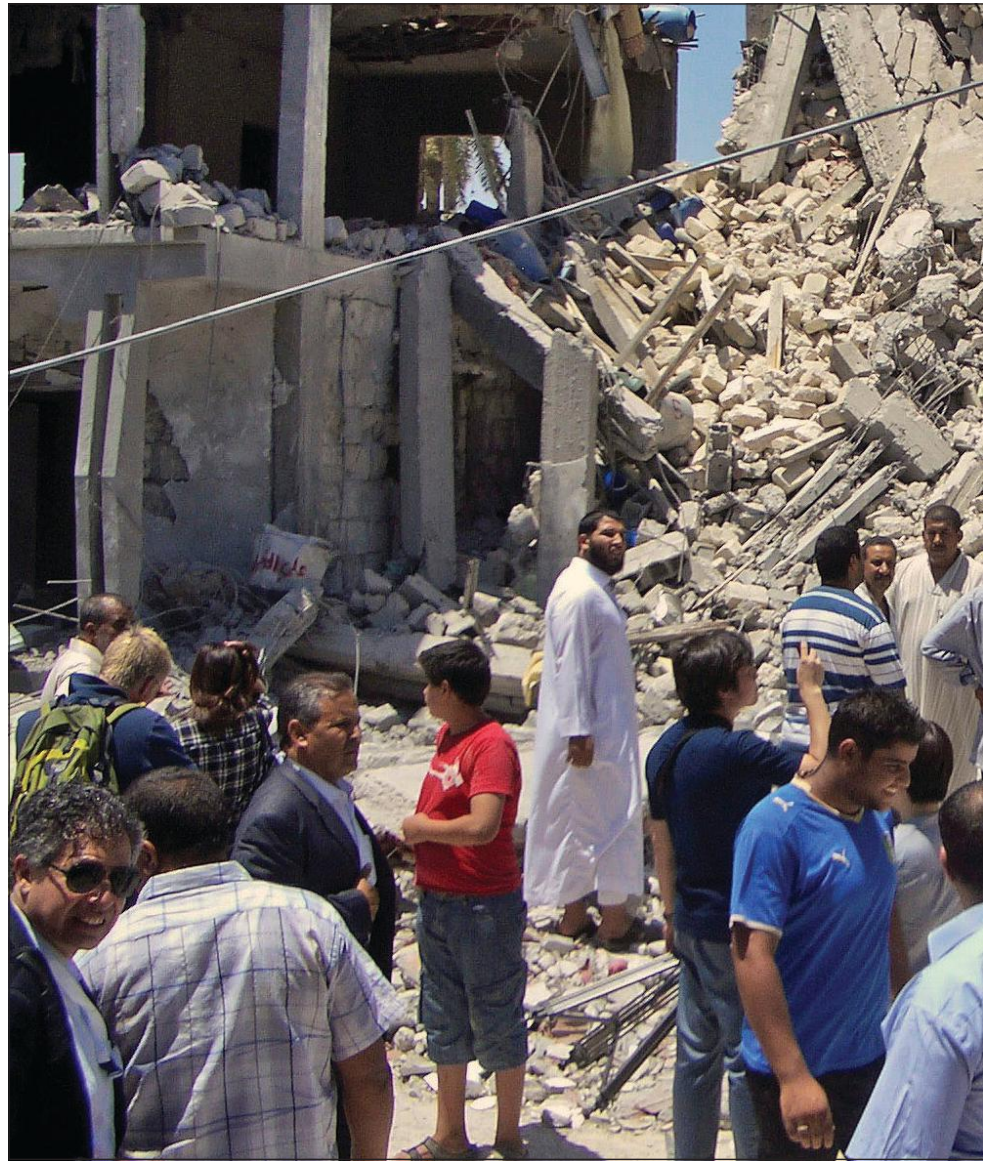
2011: Dette bildet fra juni 2011 viser ødeleggelsene i Tripoli, Libya, etter NATO-bombingen. mener kronikkforfatteren.

Det ble tidlig klart at Nato-landenes agenda i Libya ikke var en beskyttelse av sivile, men en deltakelse i en krig som hadde som hovedmål å sørge for Gaddafis fall. Det er hevet over enhver